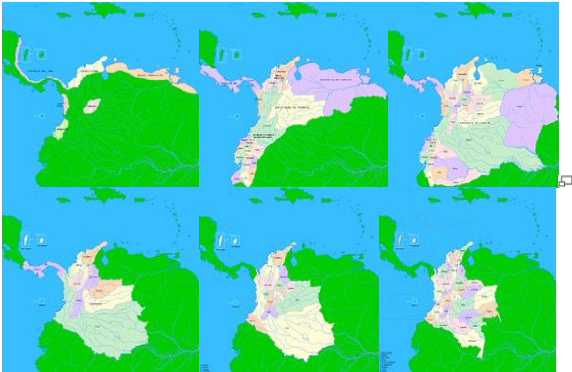
Mapas de la Republica de Colombia en 1510 (arriba izquierda), 1538 (arriba centro), 1717 (arriba derecha), 1886 (abajo izquierda), 1905 (abajo centro) y la actual Republica en 2017 (abajo derecha) en 2017

En 1810 se obtiene la independencia de España, creándose la Gran Colombia, la cual incluía las actuales repúblicas de Venezuela y Ecuador. Debido a luchas y liderazgos internos se fortalecen los movimientos separatistas, dividiéndose más tarde en las actuales tres naciones.