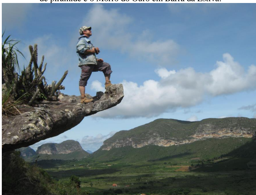
Figura 3 - Mirante do Campo Redondo – Ibicoara-BA. 2010. Uma das visões mais famosas que projetou Ibicoara no cenário do ecoturismo nacional e mundial. Ao fundo no último plano - em forma de pirâmide é o Morro do Ouro em Barra da Estiva.

A Chapada Diamantina se configura em diversos compartimentos geomorfológicos ricos de potenciais paisagísticos. Por ser uma região de acúmulo paleo-geológico de águas, a rede hidrográfica é também abastecida pelos mananciais subterrâneos. A ação descontrolada e a expansão agrícola voltada para os grandes mercados feita sem o manejo ambiental adequado têm provocado um déficit na oferta natural de água, o que tem se refletido nas economias das comunidades locais (SZMRECSÁNYI, 1979; SILVEIRA, 1987; CASTRO, 1996).