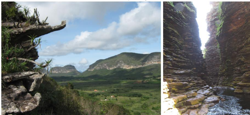
Figura 1 - Campo Redondo e Canyon da Cachoeira do Buração - Ibicoara. Chapada Diamantina – BA. Pelos princípios de N. Steno pode-se inferir a correlação entre as camadas sedimentares espacialmente dispersas com base na lei da superposição (V. Teixeira, idem).

Pelo menos quatro dos princípios estratigráficos ainda hoje utilizados foram estabelecidos há mais de 300 anos: Nicolau Steno, em 1669, cunhou o princípio da horizontalidade original , a lei da superposição e o princípio da continuidade lateral das camadas sedimentares (ver fig. 1), enquanto James Hutton, em 1795, definiu o princípio estratigráfico que trata das relações de intersecção entre rochas e o das inclusões (TEIXERA, s/d).