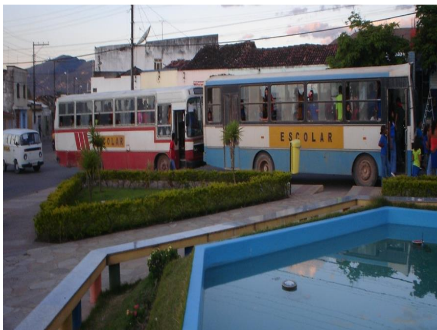
Figura 6 - Praça de Ibiçara com vários ônibus escolares patrocinados pela prefeitura em 2005, movimentando a população na rede municipal de ensino, através dos povoados. Essa realidade não mudou em 2021, mas tem se agravado na Bahia e no Brasil.

É urgente em todos os lugares o desenvolvimento de uma rede integrada de ensino, das creches e do ensino fundamental à pós-graduação. As propriedades da natureza são dados a priori em qualquer planejamento e gestão, seja a que nível objetivo. Por isso o desenvolvimento social enquanto modus operandi objetivando uma qualidade de vida mais elevada é primordial. A criação de escolas com infraestrutura plena seria no meu entender a melhor política para fazer crescer e desenvolver plenamente as sementes do futuro, os filhos da nação. A questão da mobilidade dos transportes escolares e dos discentes é também uma questão crucial (Fig. 6.).