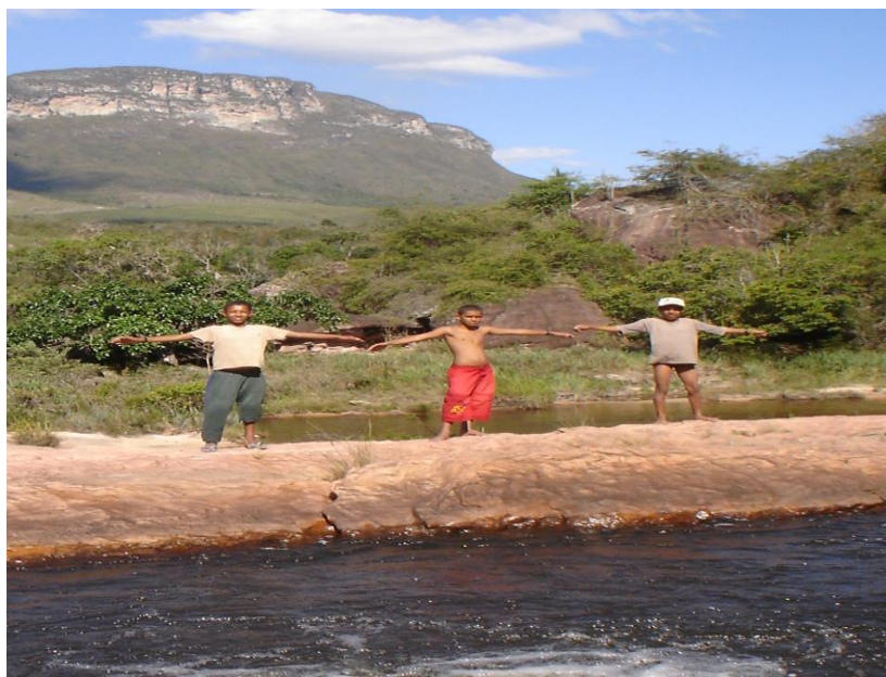
Figura 7 - Crianças simbolizando a necessidade de união para o despertar de uma nova consciência de manejo ambiental por parte de toda a sociedade.