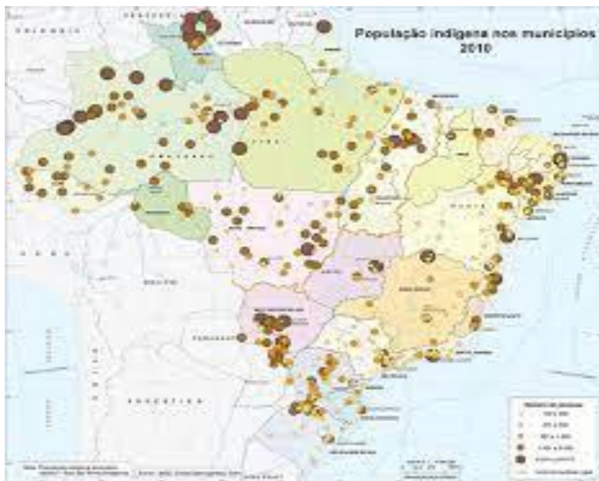
Fonte – ibge-lanca-mapa-da-populacao-indigena-no-pais