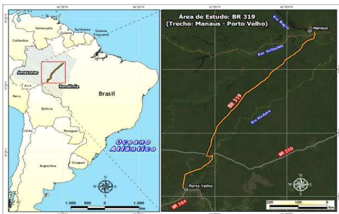
Figura 2. Mapa de localização da área do estudo BR-319.

Sobre a área de influência física da rodovia BR-319, pode-se dizer que a mesma atinge diretamente 11 municípios atravessando seus territórios, sendo estes: Beruri, Borba, Canutama, Careiro Castanho, Careiro da Várzea, Humaitá, Manaquiri, Manaus, Manicoré, Tapauá, e Porto Velho. É capaz de influenciar, também, municípios conectados à BR-319 por outras rodovias como Lábrea pela rodovia federal BR-230 (Transamazônica) e Autazes pela rodovia estadual AM-254 (Meirelles, et al. 2018).