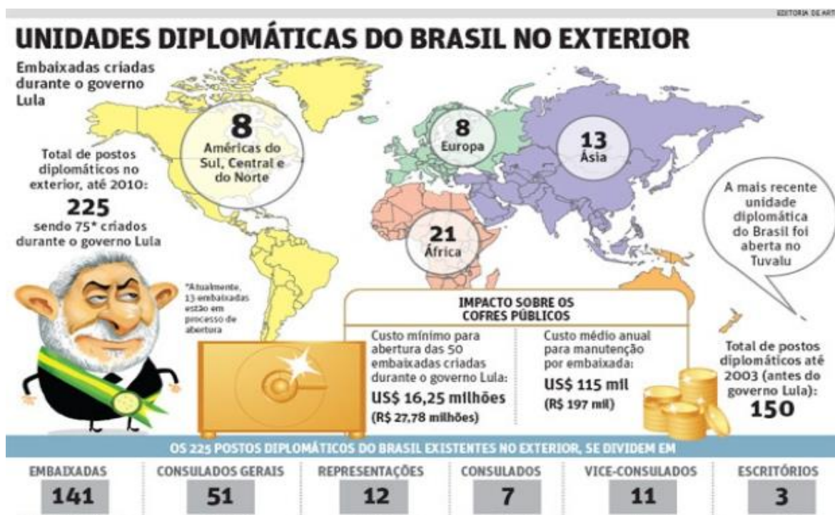
Figura 1: Unidades Diplomáticas do Brasil no Exterior Fonte: O Tempo.com.br (2010).

As pretensões brasileiras de um assento permanente têm como estratégia o capital político-diplomático acumulado (Figura 1), respaldado na noção de resolução pacífica dos conflitos que lhe credenciaria um papel mais destacado, de interlocutor em crises internacionais. Entretanto, as ações do governo brasileiro, desde o governo Lula, não se restringem a essa linha de atuação, uma vez que a presença em missões de paz da ONU está inserida dentro dessa estratégia. A implantação de novas embaixadas em vários continentes, como já comentado, representa esse projeto, como pode ser verificado através da ilustração seguinte.