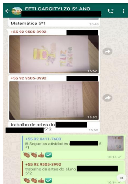
Figura 1–Print do envio de atividade