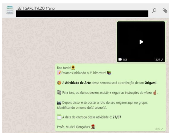
Figura 3— print do envio de atividade

A ideia de pesquisar e usar vídeos prontos e buscá-los na plataforma YouTube , ao invés de produzi-los, se deu devido à ausência de recursos tecnológicos próprios que me permitissem produzir conteúdos audiovisuais de qualidade, e, ainda, pela ausência desse recurso para as turmas de 1º ao 5º ano do Ensino Fundamental I, no Programa Aula em Casa.