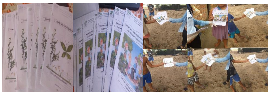
Figura 6 - Entrega das cartilhas na comunidade

Na segunda etapa do projeto, elaborou-se duas cartilhas didáticas sendo estas utilizadas como técnica para a promoção da Educação Ambiental. As cartilhas “educação ambiental por meio da compostagem” e “coletas botânicas e Herbário” foram elaboradas pela equipe do Projeto em forma de revista em quadrinhos, baseadas em diversas referências, presentes em livros, artigos e outras cartilhas. A distribuição do material ocorreu na comunidade através de abordagem figura 6. Na busca de despertar o interesse dos alunos, o material foi produzido com um tom mais lúdico possuindo muitas imagens, pouco texto e uma linguagem simples para fácil compreensão. Ao final de cada cartilha, foram elaboradas atividades de pintura a respeito do que foi ilustrado na cartilha com intuito de incentivar a leitura do material produzido.