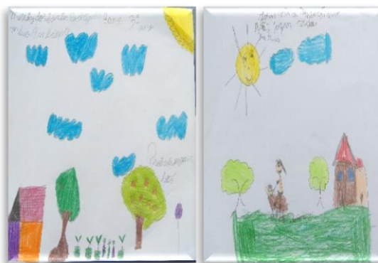
Figura 2 - Desenhos das crianças representando o meio ambiente

Nesse primeiro momento foram identificados pontos positivos em relação ao entendimento dos alunos sobre os temas propostos. Assim como no trabalho de Silva & Mota (2017), constatou-se o empenho das crianças aos ensinamentos passados e observou-se que alguns detinham algum conhecimento sobre os temas, sendo possível afirmar que a escola já desenvolve trabalhos voltados a educação ambiental. Ao final de cada atividade, os alunos confeccionaram desenhos a respeito dos temas abordados sendo importante ressaltar que em todos os desenhos há representações de árvores, plantas e animais (Figura 2), considerando que o desenho por ser a expressão do que a criança vê, sabe e pensa sobre o que está ao seu redor, torna-se um instrumento útil para se fazer uma análise das informações (SANTOS et al., 2015).