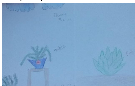
Figura 5 - Representação de plantas medicinais conhecidas pelos alunos