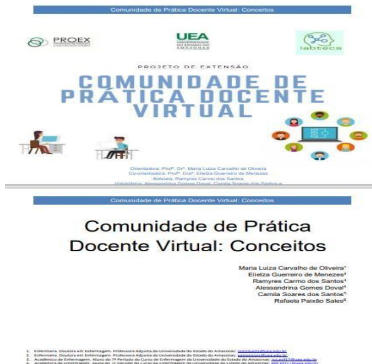
Figura 5 - Criação da apostila sobre a Teoria da Comunidade de Prática

Após esse primeiro encontro, acertou-se a criação e disponibilização de uma produção técnica sobre a teoria da comunidade de prática para maior entendimento dos participantes sobre a proposta do projeto e maior fortalecimento dos conteúdos ministrados pela palestrante na atividade, também como proposta de discussão para os próximos encontros, que foram marcados para os meses seguintes. Esta produção, mostrada na Figura 5, foi disponibilizada na Comunidade, na plataforma do AVA, para o acesso dos docentes.