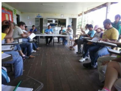
Figura 3: Escola Municipal “Pedro Reis Ferreira”