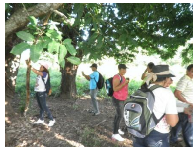
Figura 4: Trilha Ecológica