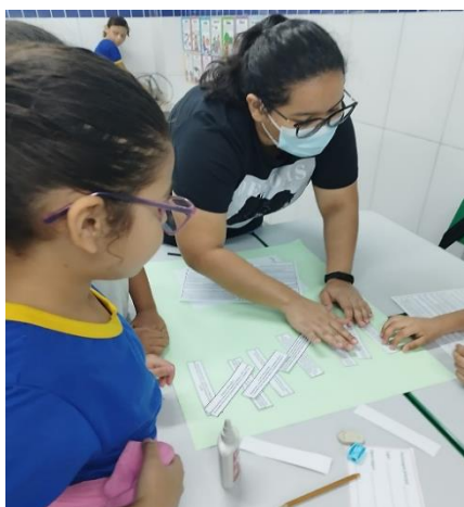
Figura 1: Atividade realizada durante o projeto de aprendizagem

Cada equipe recebeu uma cartolina para montar o texto e utilizar a criatividade para confeccionar o cartaz. Para a atividade 3, foi entregue à cada equipe uma caixa contendo quatro dados, com os quais eles sorteariam os personagens e objetos da história que eles criariam na atividade 4. Cada dado definia quem seria o personagem principal, o vilão, o lugar e o objeto mágico da história. Após o sorteio, foi entregue uma folha para cada equipe, e, juntos, eles puderam criar a própria história a partir dos personagens sorteados.