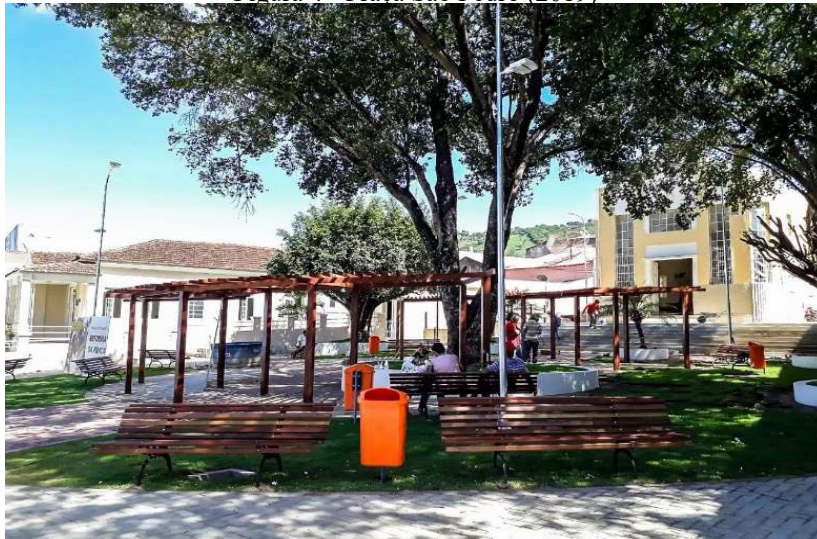
Figura 4 - Praça São Pedro (2019)