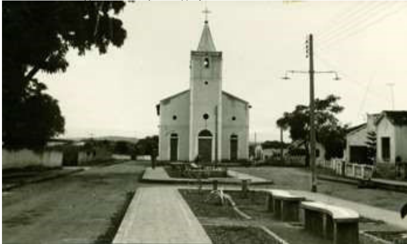
Figura 1 - Praça da igreja Matriz de São Cristóvão