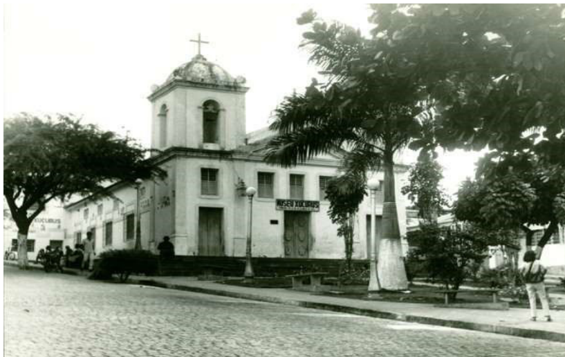
Figura 6 - Praça do Rosário (Praça do Museu Xucurus)