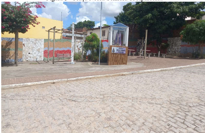
Figura 3 - Praça Nossa Senhora de Aparecida