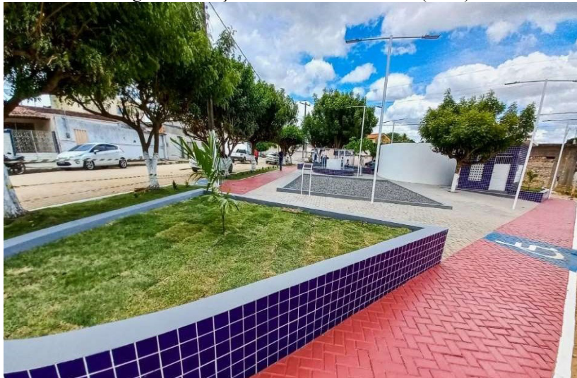
Figura 2 - Praça São Francisco de Assis (2021)