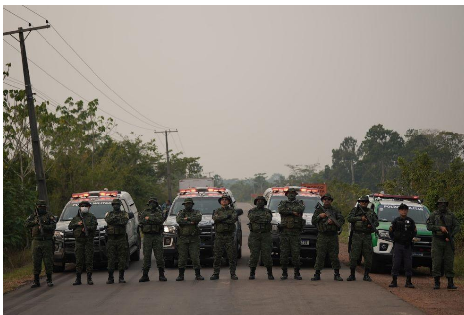
Figura 3. Polícia Militar Ambiental do Amazonas.

Além das operações repressivas, o BPAmb realiza atividades educativas, como palestras e oficinas sobre preservação ambiental, voltadas a escolas e comunidades indígenas. Essas iniciativas fortalecem a consciência ecológica e fomentam a corresponsabilidade cidadã, criando uma cultura de proteção ambiental aliada à valorização dos saberes tradicionais (PMAM, 2025).