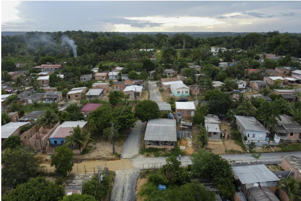
Figura 2. Parque das tribos.