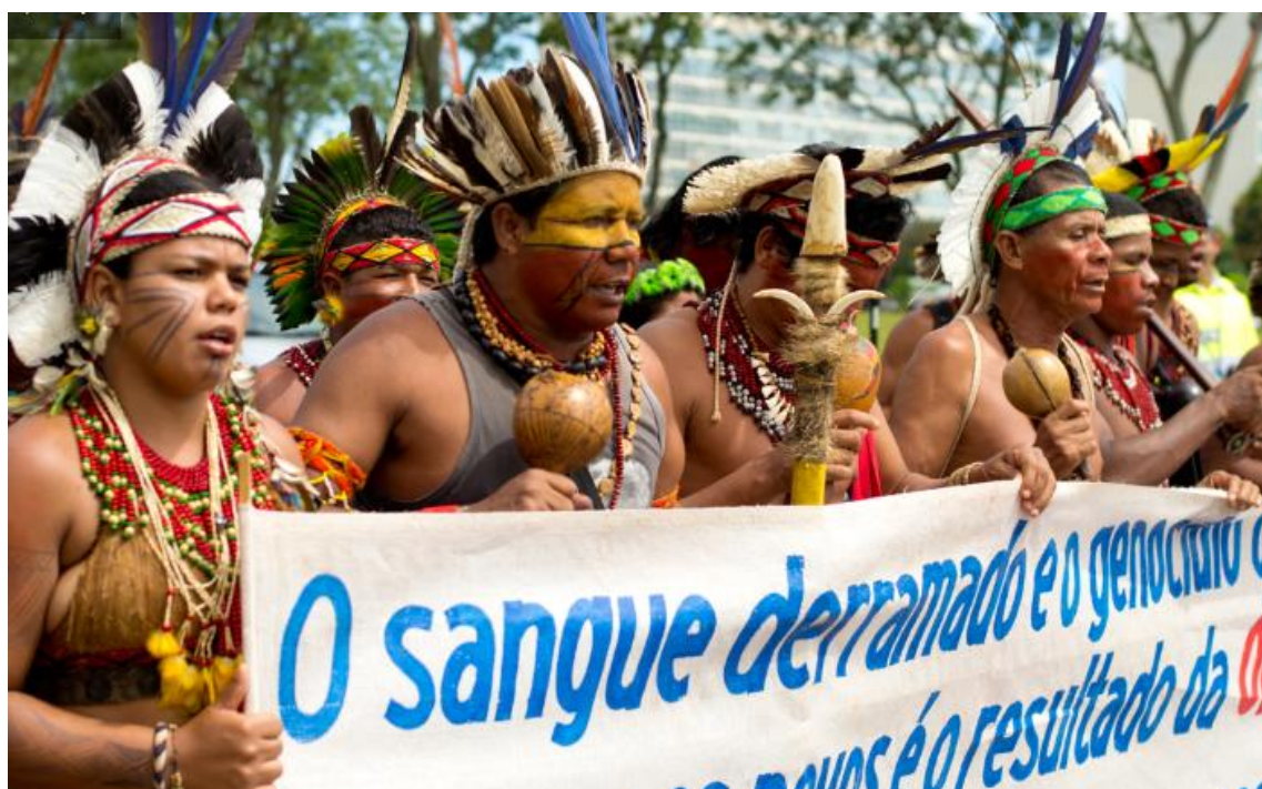
Figura 4. Povos indígenas em reivindicações.

Esses resultados demonstraram que a mediação de conflitos em territórios indígenas urbanos requer abordagens intersetoriais e interculturais, capazes de integrar práticas comunitárias e institucionais em prol da justiça social, da paz comunitária e da preservação ambiental. Por isso, povos indígenas continuam lutando por seus espaços a fim de manter viva sua tradição e cultura. (Figura 4).