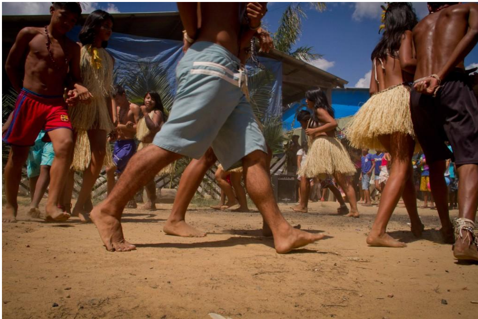
Figura 1. Parque das tribos.

Além de propiciar a resolução pacífica de conflitos, essas formas de mediação fortalecem os laços identitários e consolidam a autonomia das comunidades indígenas. Gomes e Pereira (2020) ressaltam que o reconhecimento estatal dessas práticas contribui para a valorização da justiça comunitária e para a redução de intervenções externas, que muitas vezes desconsideram as especificidades socioculturais dos povos originários. Assim, a preservação de sua identidade através de seus próprios costumes, indicando os mais velhos como liderança, buscando a coletividade como forma de união e resolvendo seus conflitos internos através do consenso aprendemos que tais formas de mediação vão além daquelas praticadas pela justiça brasileira que tendem a querer excluir e retirar os povos originários de suas terras.