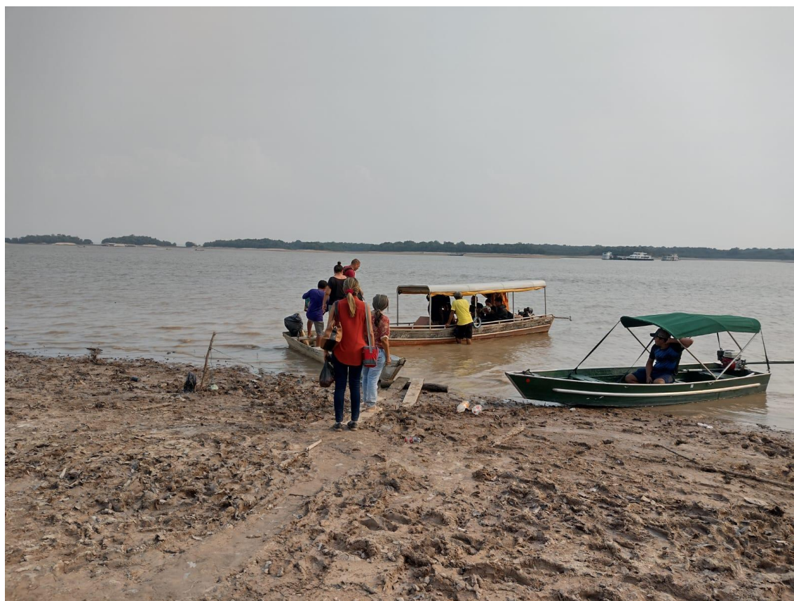
Figura 13 – Professores embarcando na rabeta