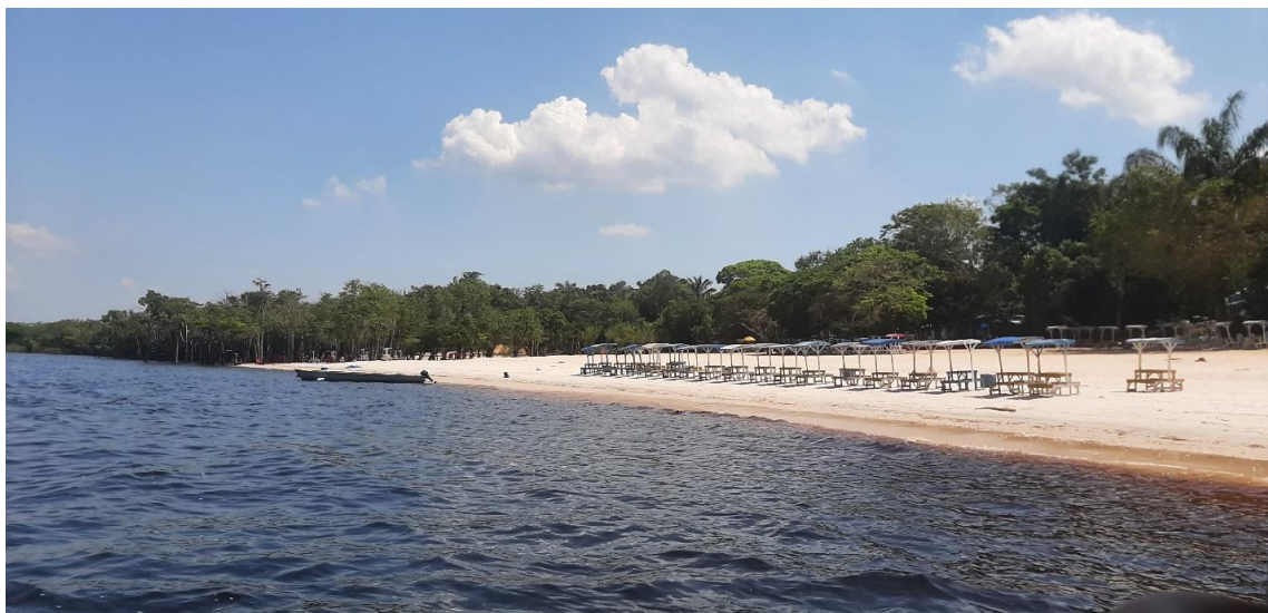
Figura 6 – Praia da Lua, Manaus-AM.