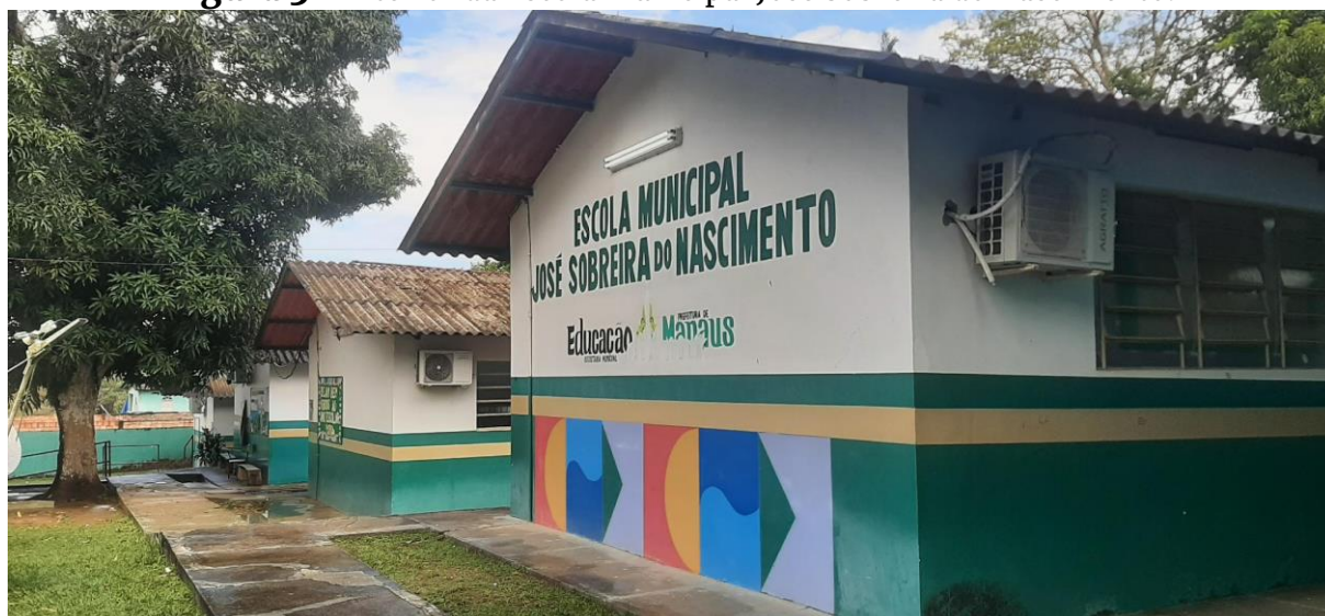
Figura 3 - Interior da Escola Municipal José Sobreira do Nascimento.

Em seu interior, há 12 salas, Centro de Tecnologias Educacionais (CTE), Sala de Recursos e Biblioteca. Além disso, no turno noturno a escola é a sede do ensino médio televisionado proporcionado pela Secretaria de Estado de Educação e Desporto Escolar (SEDUC).