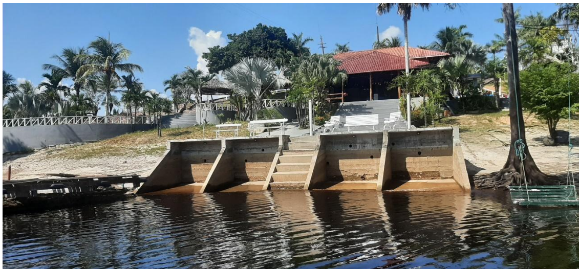
Figura 9 - Desembarque de um estudante da Escola Municipal José Sobreira do Nascimento.