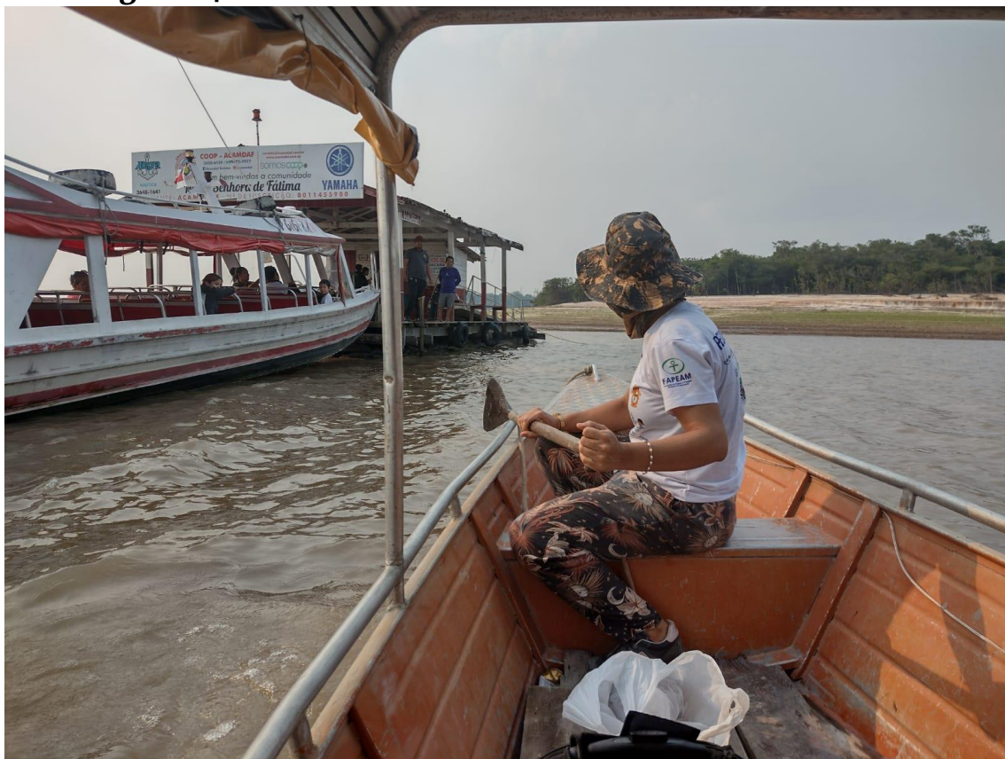
Figura 14 - Porto Flutuante da Comunidade Nossa Senhora de Fátima.