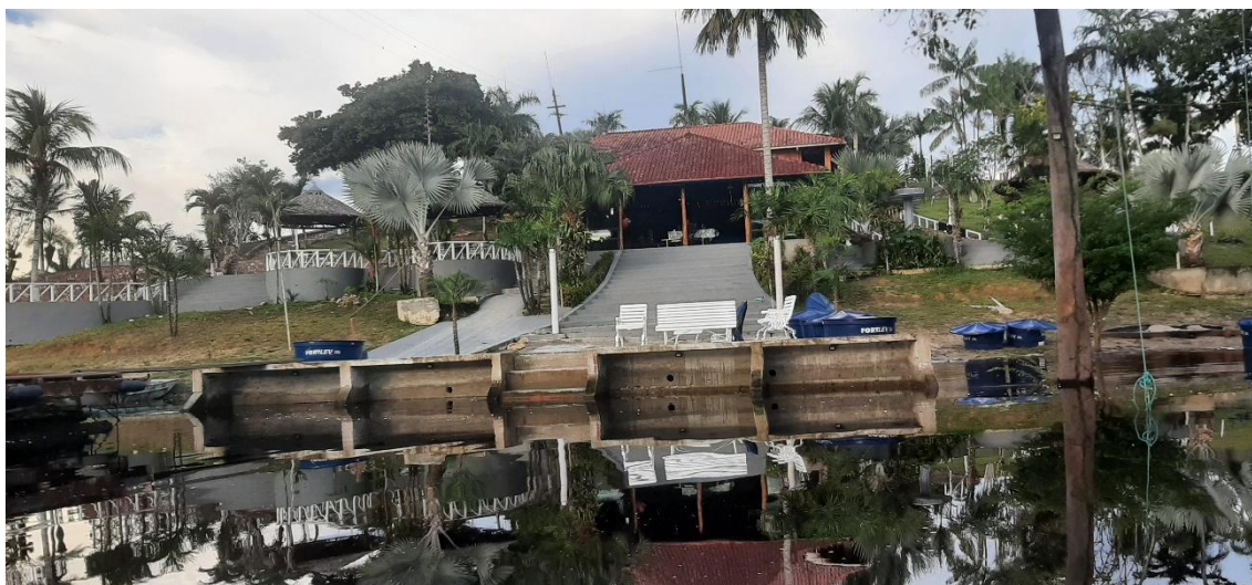
Figura 8 - Desembarque de um estudante da Escola Municipal José Sobreira do Nascimento

Uma vez nesse lugar, deparo-me com o caminho dos estudantes. Ao registrar o trajeto dos alunos, foi possível notar algumas mudanças da cheia e da vazante num curto intervalo de tempo.