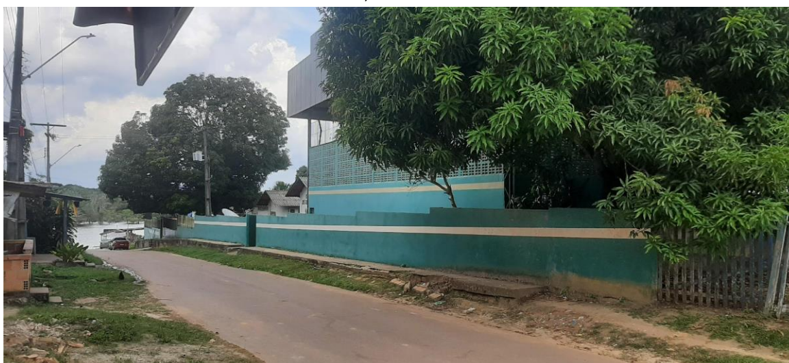
Figura 2 - Escola Municipal José Sobreira do Nascimento, Comunidade Nossa Senhora de Fátima, Manaus-AM.

No que se refere à educação, interesse desse texto, destaco o ensino formal realizado na Escola Municipal José Sobreira do Nascimento (Figura 2).