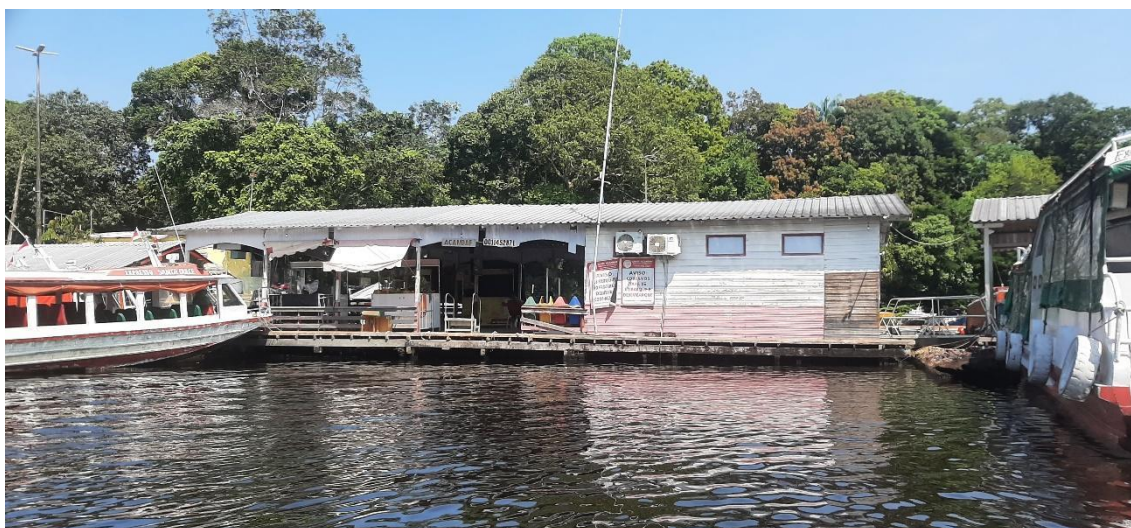
Figura 5 – Porto Fluvial Marina do Davi.

Meu ponto de partida foi o Porto Flutuante Marina do Davi, administrado pela Cooperativa dos Profissionais de Transporte Fluvial da Marina do Davi (ACAMDAF). Localiza-se no bairro Ponto Negra, zona Oeste de Manaus.