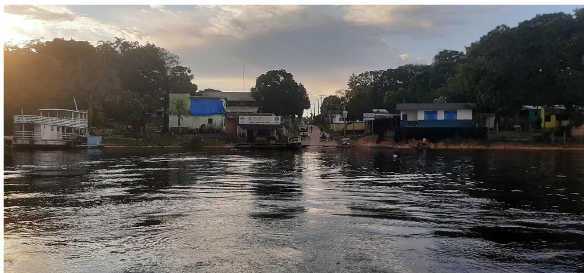
Figura 7 – Comunidade Nossa Senhora de Fátima, Manaus-AM.