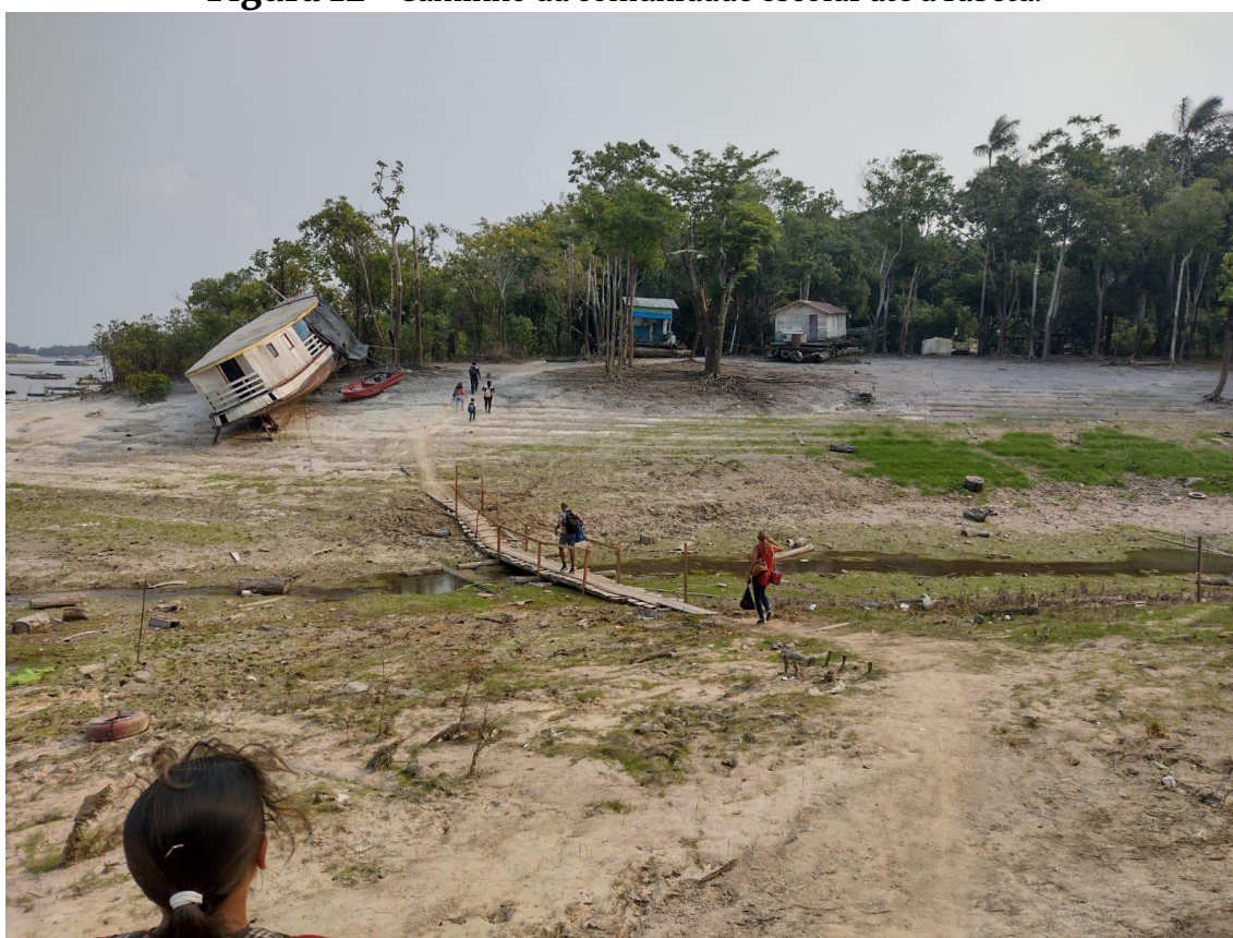
Figura 12 - Caminho da comunidade escolar até a rabeta.

Para embarcar, foi necessário caminharmos cerca de 10 minutos, sendo apenas o último trecho sombreado (Figura 12):