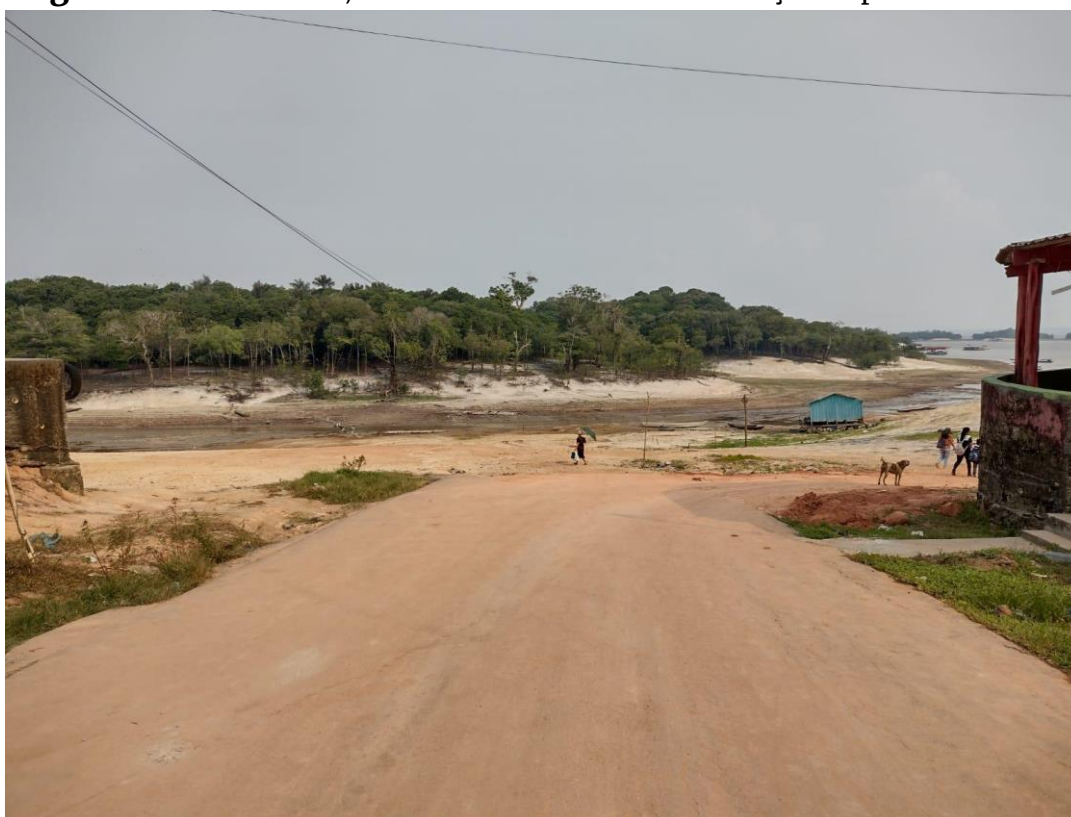
Figura 11 - Professores, estudantes e monitores em direção ao porto flutuante.