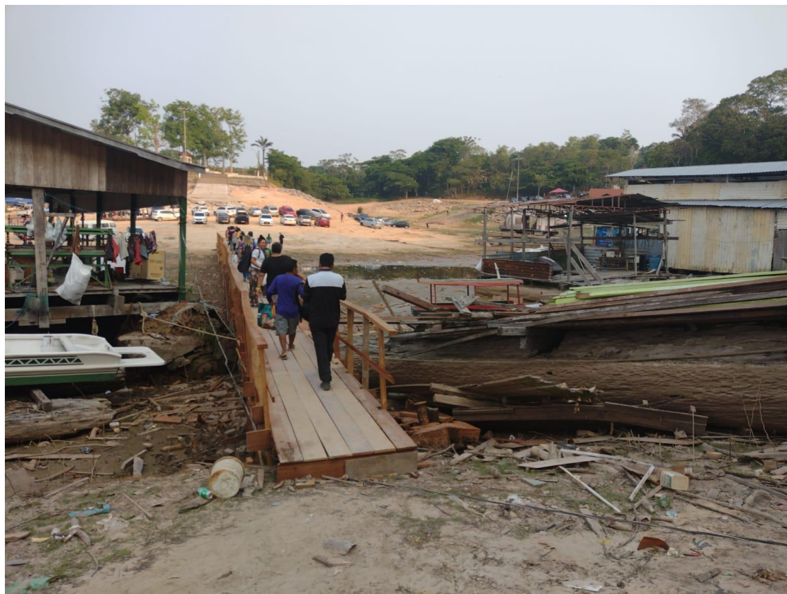
Figura 17 - Trajeto após o desembarque no Porto Flutuante da Marina do Davi.

Ao redor, o que antes era água, tornou-se um estacionamento arenoso. Onde antes havia lanchas, agora há carros empoeirados. Por conta disso, o desembarque exigia mais um trecho a pé: