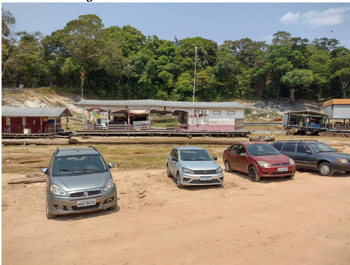
Figura 16 - Porto Flutuante da Marina do Davi.