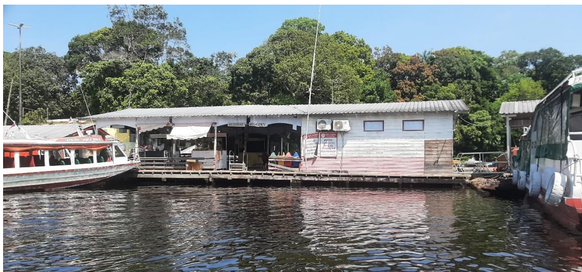
Figura 15 - Porto Flutuante da Marina do Davi.