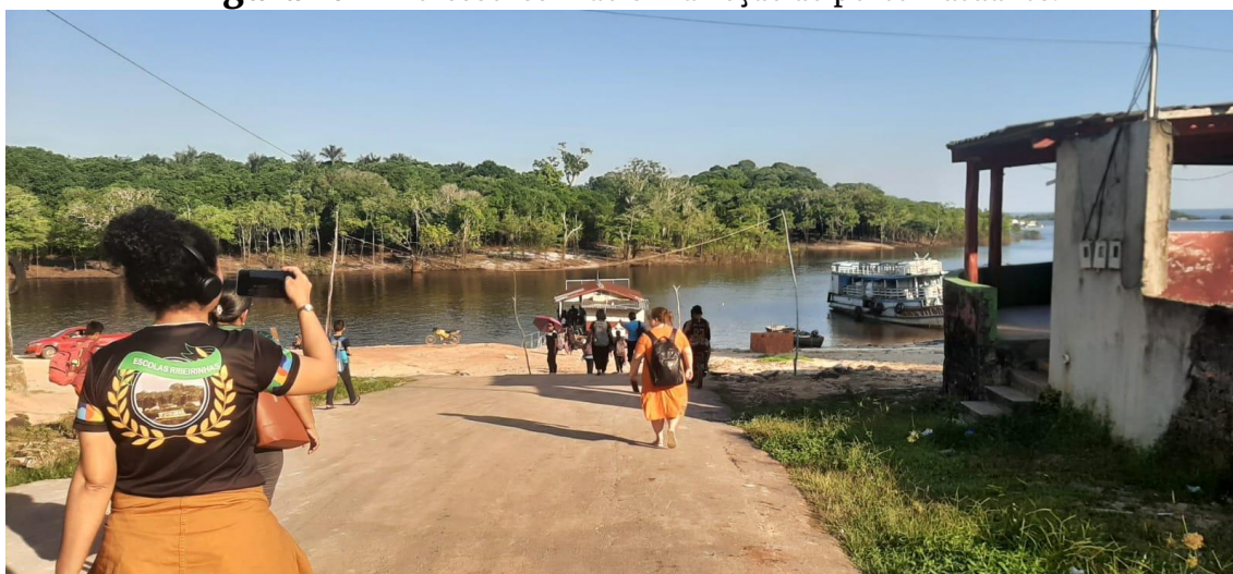
Figura 10 - Professores indo em direção ao porto flutuante.

No caminho dos professores, que eu também percorria para retornar à cidade e por isso registrei de forma mais prolongada, foi capturada a seguinte mudança (Figura 10):